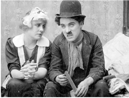
1915 CHARLOT APPRENTI (Work) de Charles Chaplin avec Charles Chaplin