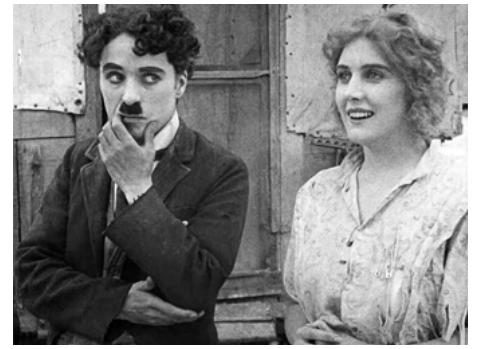
1915 LE VAGABOND (The Tramp) de Charles Chaplin avec Charles Chaplin