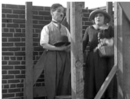
1922 JOUR DE PAYE (Pay Day) de Charles Chaplin avec Charles Chaplin