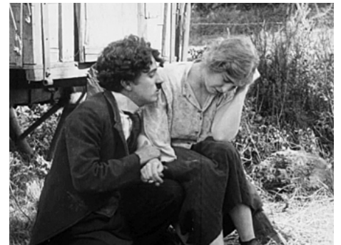
1916 CHARLOT MUSICIEN (The Vagabond) de Charles Chaplin avec Charles Chaplin