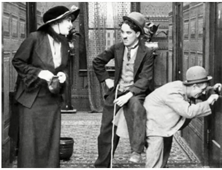
1915 CHARLOT FAIT LA NOCE (A Night Out) de Charles Chaplin avec Charles Chaplin, Ben Turpin