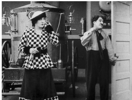
1916 CHARLOT POMPIER (The Fireman) de Charles Chaplin avec Charles Chaplin