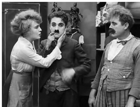
1916 CHARLOT USURIER (The Pawnshop) de Charles Chaplin avec Charles Chaplin, John Rand