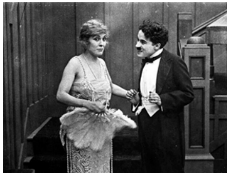
1917 CHARLOT S'ÉVADE (The Adventurer) de et avec Charles Chaplin