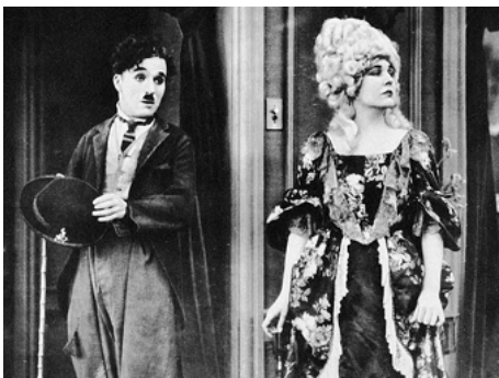
1921 CHARLOT ET LE MASQUE DE FER (The Idle Class) de et avec Charles Chaplin