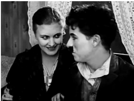
1919 UNE IDYLLE AUX CHAMPS (Sunnyside) de et avec Charles Chaplin