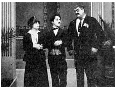
1916 CHARLOT PATINE (The Rink) de Charles Chaplin avec Charles Chaplin, Eric Campbell