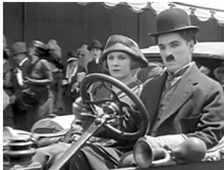
1919 UNE JOURNÉE DE PLAISIR (A Day's Pleasure) de et avec Charles Chaplin