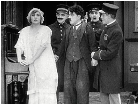
1916 CHARLOT CAMBRIOLEUR (Police) de Charles Chaplin avec Charles Chaplin, Leo White