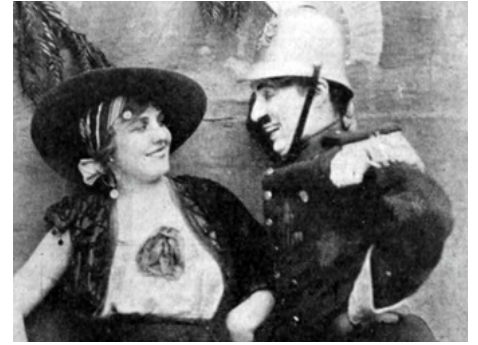
1915 CHARLOT JOUE CARMEN (Burlesque on Carmen) de et avec Charles Chaplin