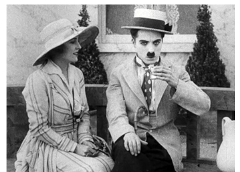
1917 CHARLOT FAIT UNE CURE (The Cure) de et avec Charles Chaplin