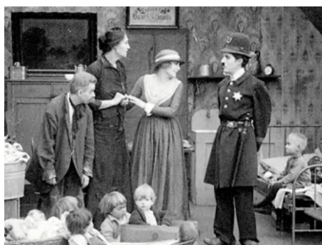
1917 CHARLOT POLICEMAN (Easy Street) de Charles Chaplin avec Charlotte Mineau, Charles Chaplin