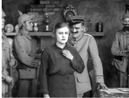
1918 CHARLOT SOLDAT (Shoulder Arms) de et avec Charles Chaplin