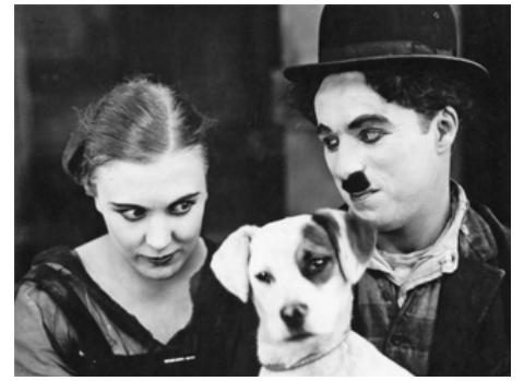
1918 UNE VIE DE CHIEN (A Dog's Life) de Charles Chaplin avec Charles Chaplin