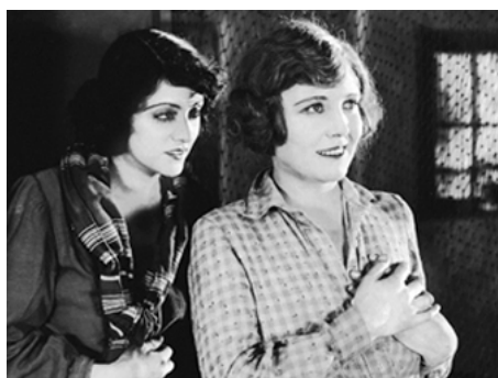
1926 A WOMAN OF THE SEA ou SEA GULLS de Josef von Sternberg avec Eve Sothern