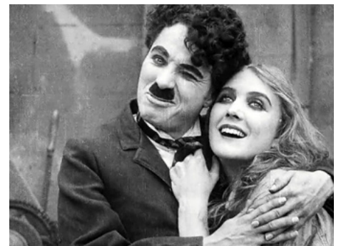
1916 CHARLOT FAIT DU CINÉ (Behind the Screen) de et avec Charles Chaplin