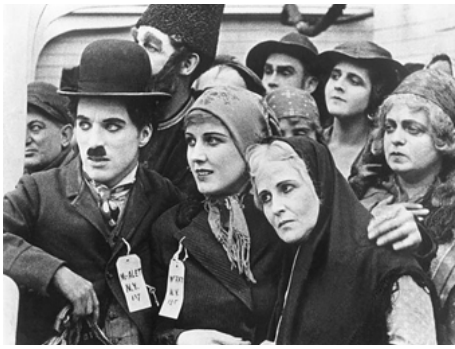
1917 L'ÉMIGRANT (The Immigrant) de Charles Chaplin avec Charles Chaplin, Kitty Bradbury