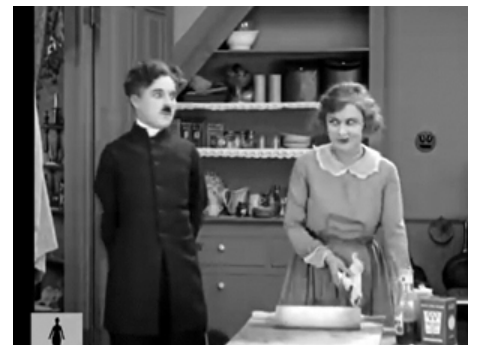
1923 LE PÈLERIN (The Pilgrim) de Charles Chaplin avec Charles Chaplin