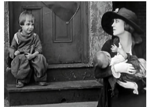
1921 LE KID ou LE GOSSE (The Kid) de Charles Chaplin avec Jackie Coogan