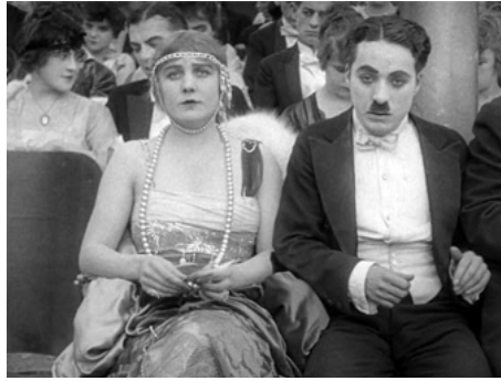
1915 CHARLOT AU MUSIC-HALL (A Night in the Show) de et avec Charles Chaplin