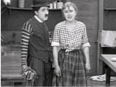
1918 LES AVATARS DE CHARLOT (Triple Trouble de Leo White avec Charles Chaplin