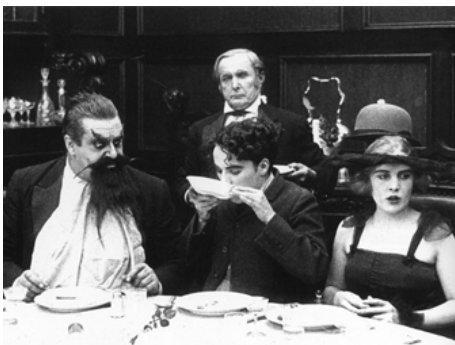
1916 CHARLOT ET LE COMTE (The Count) de Charles Chaplin avec Eric Campbell, Charles Chaplin