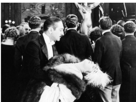
1923 L'OPINION PUBLIQUE (A Woman of Paris) de Charles Chaplin avec Adolphe Menjou