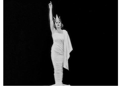
1918 THE BOND (The Bond) de Charles Chaplin