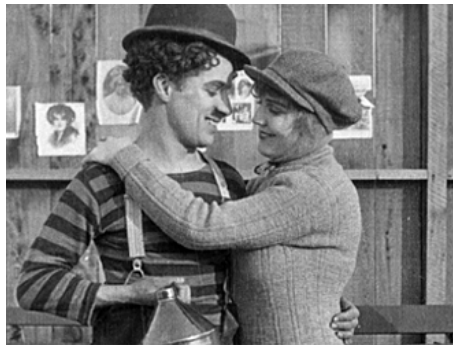
1915 CHARLOT BOXEUR (The Champion) de Charles Chaplin avec Charles Chaplin